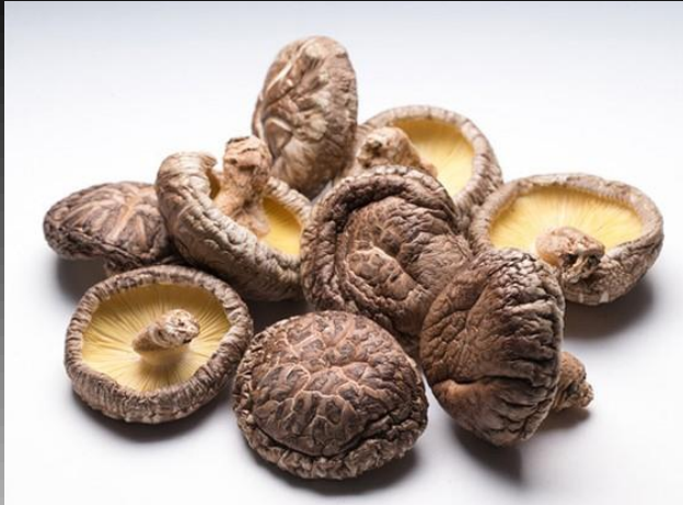
宮崎県産乾しいたけ